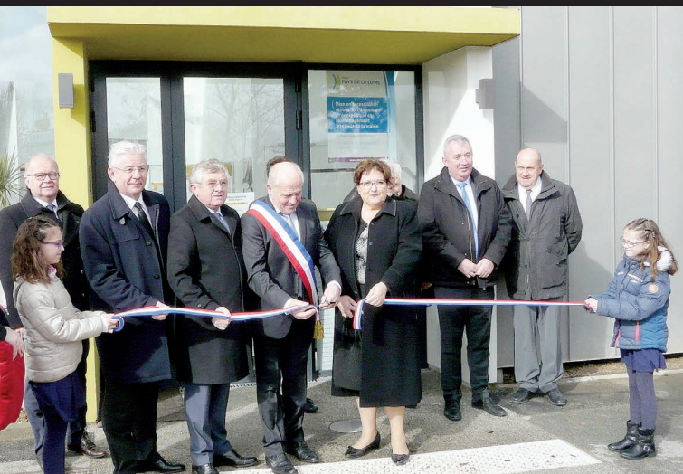
3 mars 2018 : inauguration de la nouvelle mairie.