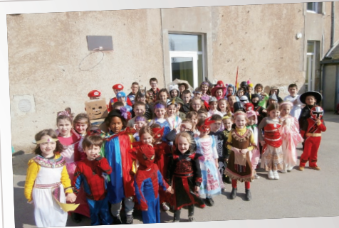
Le Carnaval de l'école Ste Thérèse