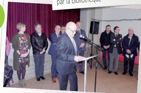
Vœux du maire