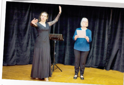
Lecture et musique Bibliothèque