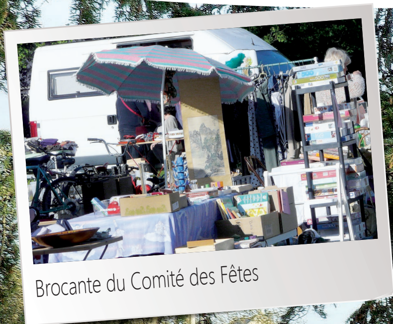
Brocante du Comité des Fêtes

Magazine d'informations municipales Octobre 2019