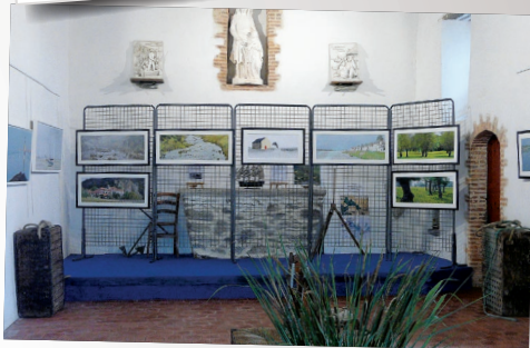
Exposition de photos de Michel DELUEN organisée par les Amis de la chapelle de Rohars