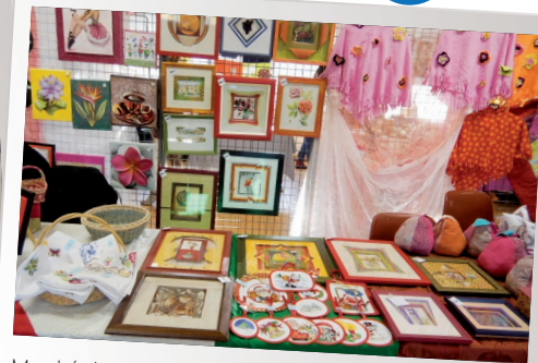
Marché de Noël de BTM