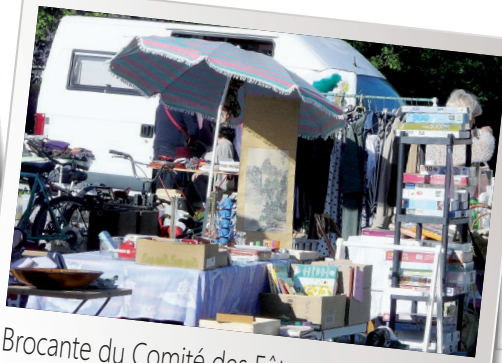
Brocante du Comité des Fêtes