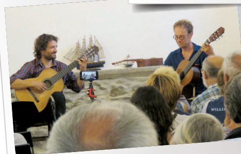
Concert d'été de la commune