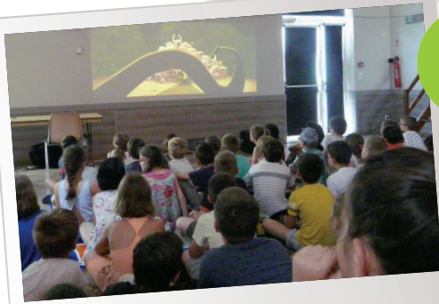
Jeudi ciné mômes bibliothèque