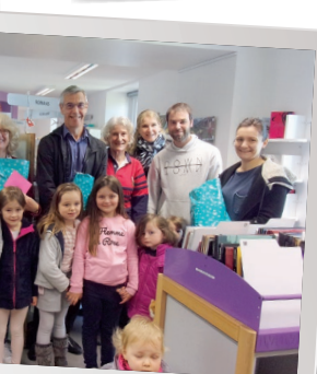
la commission culturelle