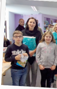
Concours de photos de