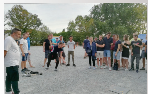
Concours de palets Amicale laïque