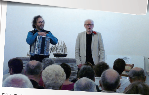
Diki Daka - contes et musique par Les Amis de la chapelle de Rohars