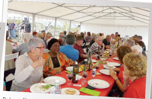
Rohars fête son porc - cochon grillé et chants de marins Comité des fêtes de Bouée