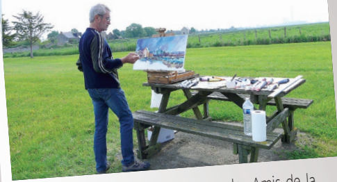
Journée des peintres dans la nature les Amis de la chapelle de Rohars