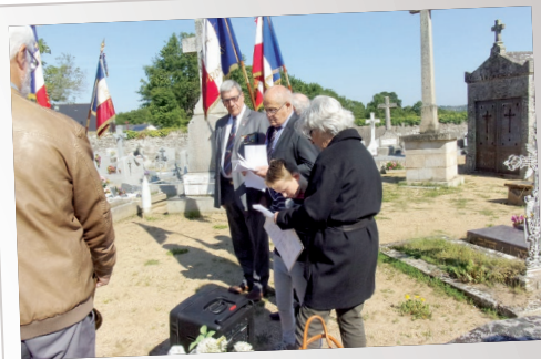
Cérémonie du 8 mai 2019