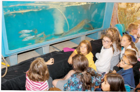
Les poissons de l'estuaire exposition des Amis de la chapelle de Rohars