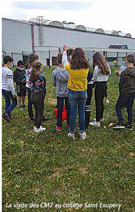
La visite des CM2 au collège Saint Exupéry