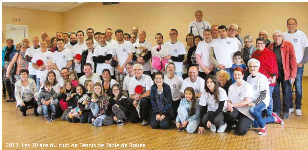
2017, Les 30 ans du club de Tennis de Table de Bouée