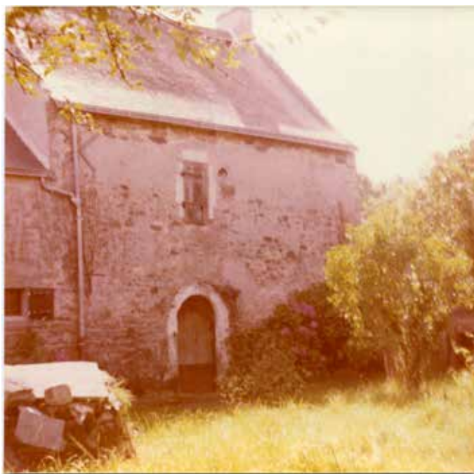
Façade septentrionale de la maison principale en août 1980

Jusqu'à la Révolution de 1789, Bouée était une succursale de la paroisse de Savenay – on disait aussi