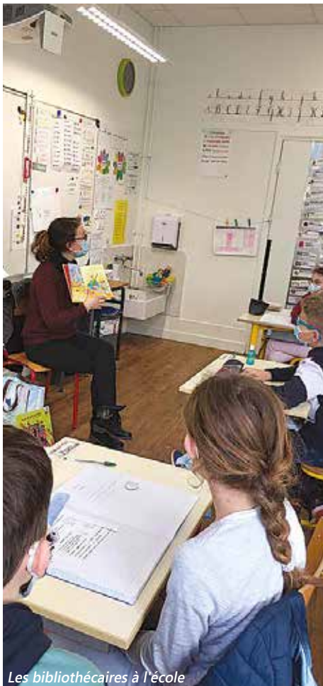
Les bibliothécaires à l'école

Une à deux fois par période, les bibliothécaires viennent dans chaque classe. Elles présentent des livres autour des enfants du monde. Les élèves apprécient vraiment ce moment. Merci à elles. Les enfants peuvent emprunter des livres et se les prêter entre eux. Vivement que nous puissions retourner à la bibliothèque qui est un lieu très apprécié des élèves.