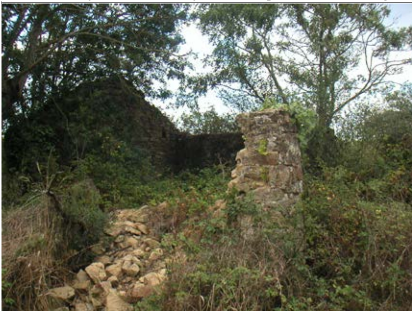
La Douais en août 2005

Le 1 er juillet 1857, une journalière qui habitait au village de Bâtard, Marie Chantreau, fut trouvée