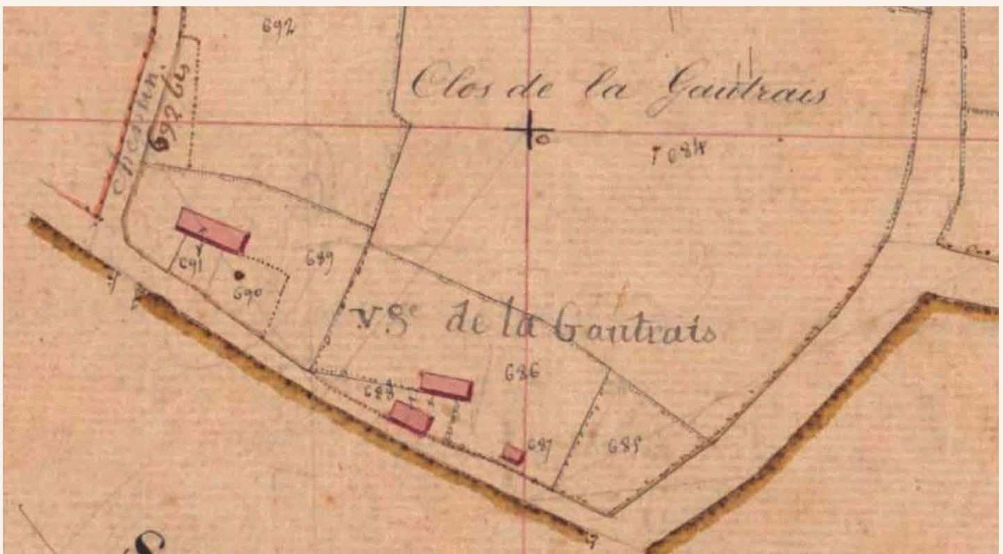
Le village de la Gautrais en 1827