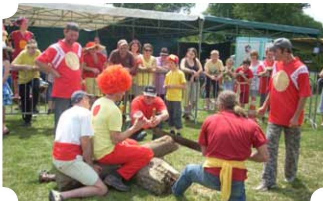
Les « Pois Chiches », vainqueurs de la dernière édition