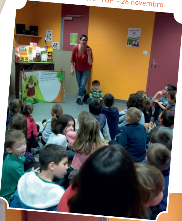
Spectacle TIP TAP TOP - 26 novembre