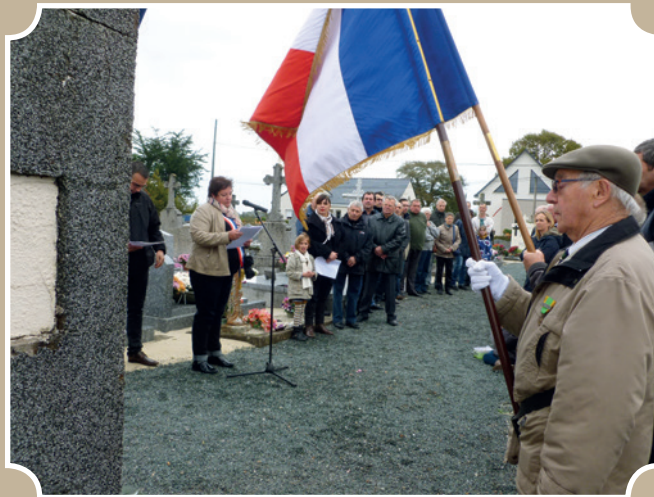
Commémoration du 11 novembre