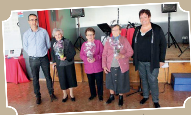
Repas des aînés du 19 novembre