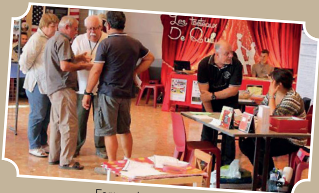
Forum des associations organisé par le Comité des Fêtes 13 septembre