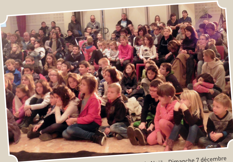
Animation de Noël - Dimanche 7 décembre