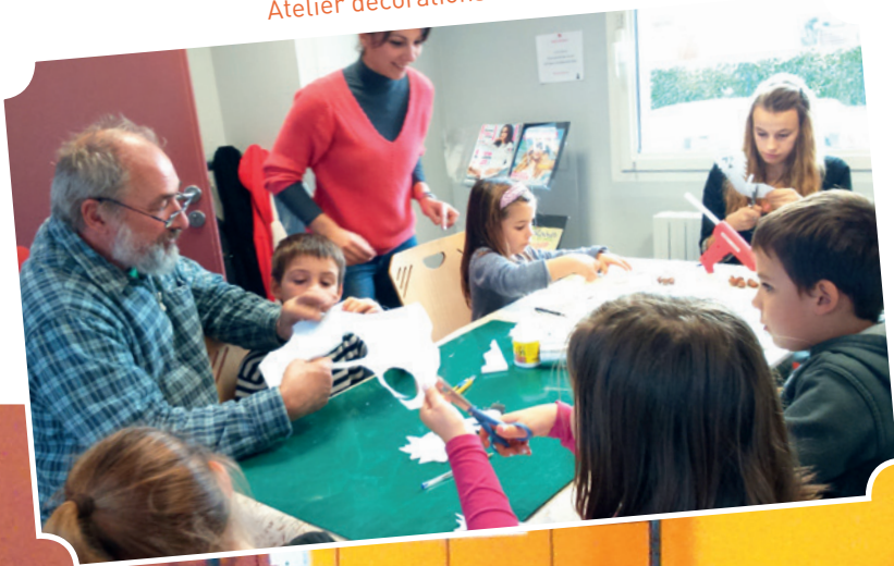
Atelier décorations de Noël