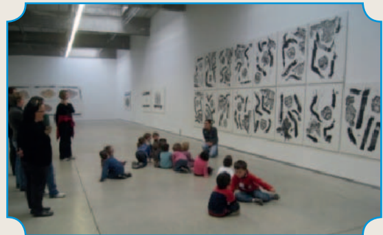
Au Hangar à Bananes