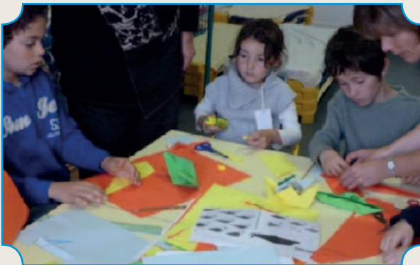
La journée art