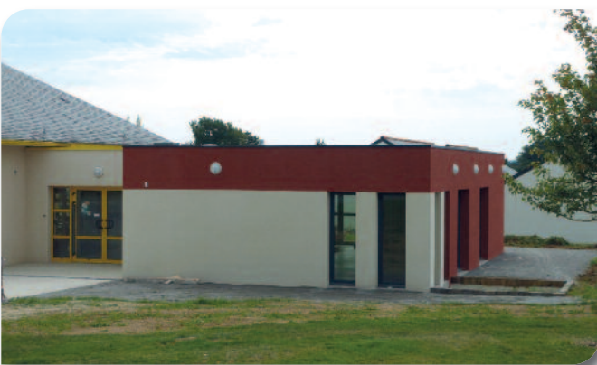
Nouvelle salle d'accueil péri-scolaire