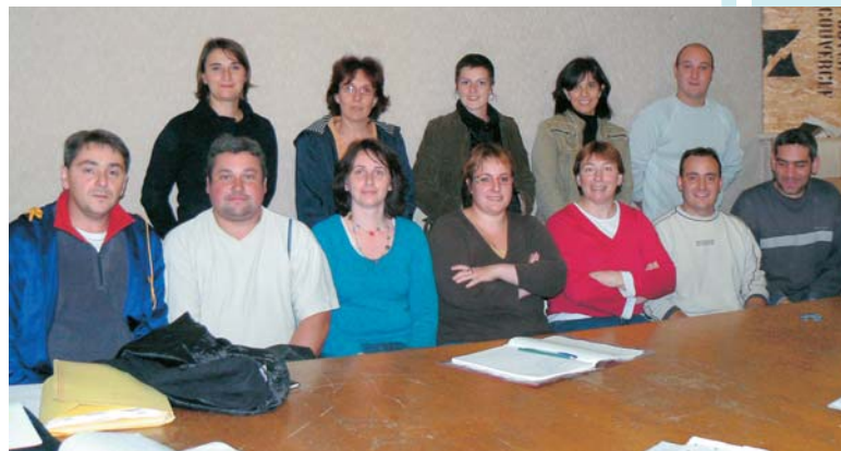
et ses membres actifs